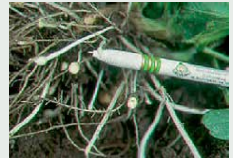
Zgrubienie stolonów – zapewnić wilgotność!

W ostatnich latach coraz częściej spotyka się w ziemniakach chorobę wywołaną przez grzyby z rodzaju Sclerotinia. Aby jej zapobiec zaleca się w programie chemicznej ochrony zastosować 2-4 razy Altimę, szczególnie na stanowiskach sprzyjających występowaniu patogena (rzepak, rzodkiew oleista, gorczyca, międzyplon.)