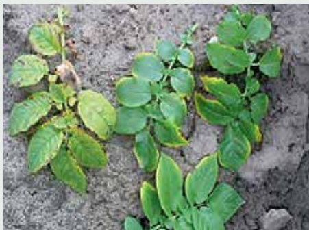
Niedobór potasu w różnym natężeniu

Na lżejszych glebach (< 40 BP) duże znaczenie ma termin przerobienia nawozów zielonych. Termin zabiegu (początek przerobu) dla trudno rozkładających się organicznych substancji (trawy polowe itp.) zaleca się wykonać późną jesienią, dla łatwo rozkładających się poplonów zielonych (rzodkiew oleista, facelia) najpóźniej 6 tygodni przed planowanym sadzeniem.