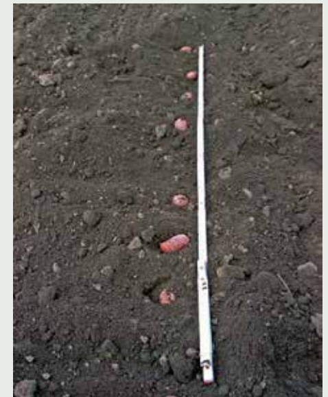
Sprawdzać dokładność sadzenia wyrywkowo na długości 3 m

Tutaj również można uwzględnić warunki produkcji i przechowywania sadzeniaków, ewentualnie pochodzenie i dostawcę materiału sadzeniakowego. Złe oszacowanie powyższych czynników niesie za sobą ryzyko uzyskania wysokich plonów i uwidacznia się w końcowym wyniku gospodarowania. Uwzględniając koszty sadzeniaków przy obliczaniu gęstości sadzenia należy uwzględnić następujące wskazówki (przy rozstawie rzędów 75 cm).