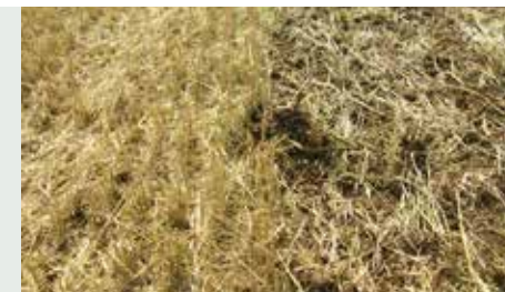
Resztki poźniwne sprawiają większe problemy z rizoktoniozą.

Ze względu na niewielkie możliwości zwalczania nicieni, areal uprawy ziemniaków nie powinien przekraczać w zmianowaniu 25%. Wiedza na temat nicieni w gospodarstwie (1-2 próby na 1 ha) jest potrzebna w razie ich wystąpienia, aby można odpowiednio wcześniej dobrać odmiany odporne.