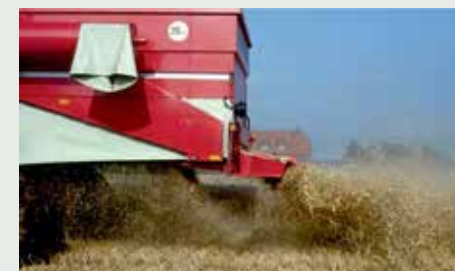
Równomierne rozrzucenie słomy na powierzchni jest bardzo ważne.