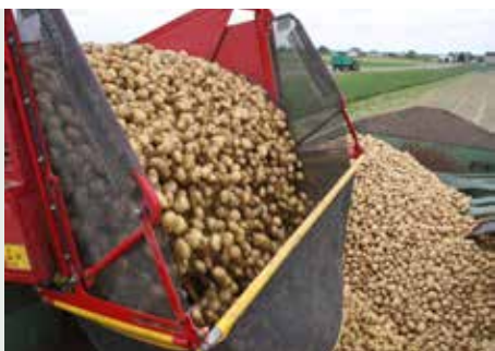
Staranne kopanie gwarantuje zbiór bez strat

Zbiór przeprowadza się zgodnie z terminem dostawy ziemniaków. Również przy wcześniejszym zbiorze na początek kampanii, 50% liści powinny być dojrzałe, gdyż w innym przypadku mogą wystąpić znaczące ubytki plonu. Przy znacznej uprawie zaleca się dobierać odmiany o różnej długości wegetacji, aby dopasowane to zostało do terminów dostawy i aby przede wszystkim nie było strat w plonie.