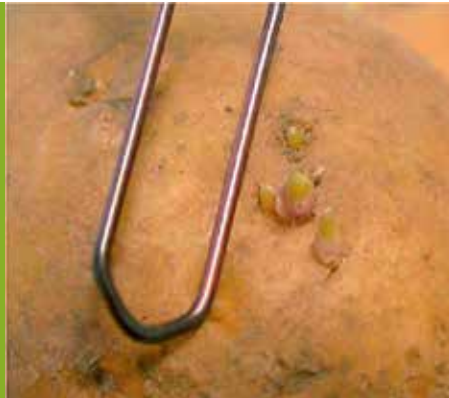
Kietki wielkości główki od szpilki w oczkach bulwy