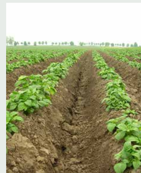
Późne obredlanie prowadzi do uszkodzeń korzeni bocznych i powoduje ulatnianie się wilgoci

Te uszkodzenia są otwartymi drzwiami dla infekcji bakteryjnych i grzybowych, które również zmniejszają plon i jego jakość. Z tych też powodów, jak również z gospodarczego punktu widzenia w ostatnich latach, koncentruje się coraz bardziej na chemicznym zwalczaniu chwastów.