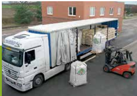
Załadunek kwalifikowanego materiału sadzeniakowego

Obliwice • Aleja Topolowa 1 84-351 NOWA WIEŚ LĘBORSKA Oddział LASKI KOSZALIŃSKIE 3A 76-039 BIESIEKIERZ tel.: 94 347 34 61