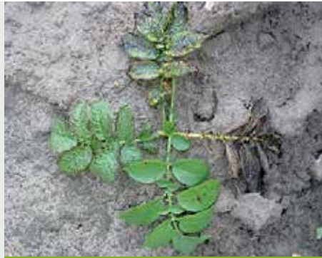
Stopnie porażenia alternariozą

Poprzez intensywną ochronę przeciwko zarazie ziemniaka można uzyskać średnio o 1 % większą zawartość skrobi, jak również wyraźnie większy plon skrobi. Intensywna ochrona przeciwko zarazie szczególnie dotyczy gospodarstw, które stosują nawodnienie. W centrum uwagi jest też alternarioza. Jest to „stresowa” choroba grzybowa, przez którą, szczególnie w odmianach późnych może dochodzić do dużych strat w plonie. Pierwsze objawy występują już wcześnie, często na początku czerwca, na porażonych rizoktoniozą lub wirusami roślinach. Dlatego w produkcji ziemniaków skrobiowych, szczególnie w grupie odmian od